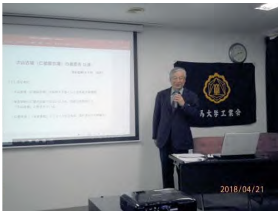
須永さん(49W) <特別講演>