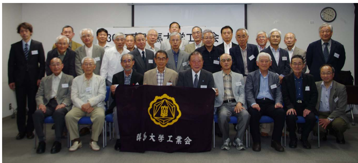
前列左から3人目、来賓の大河原連合支部長(46W)、(川崎)、三上副理事長(38W)